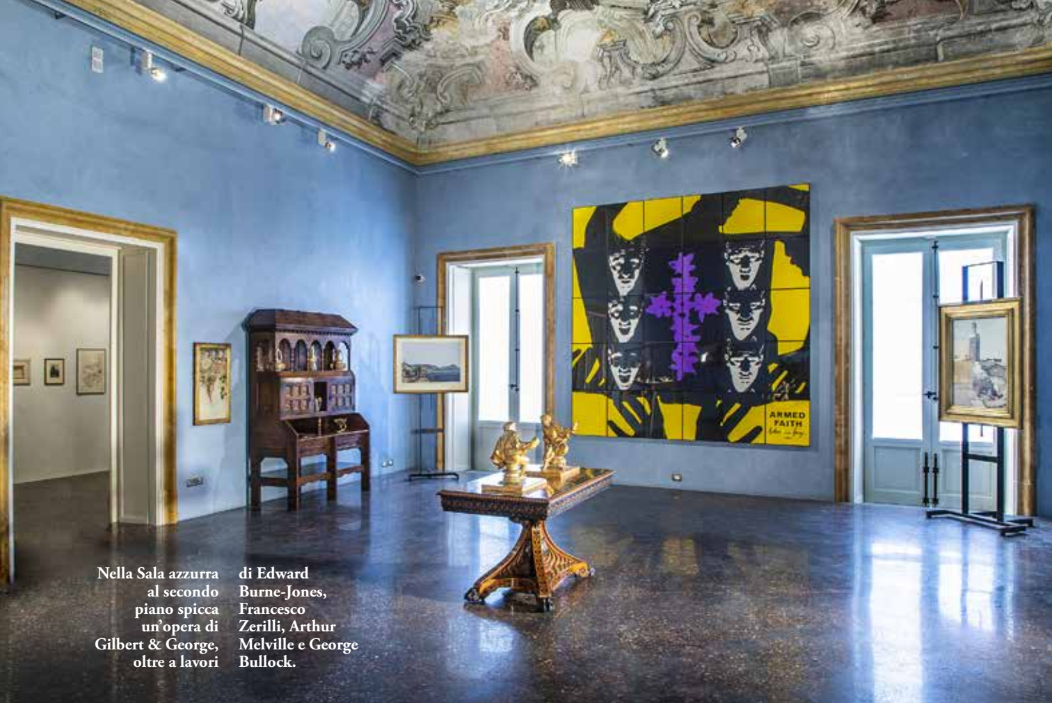
Nella Sala azzurra al secondo piano spicca un'opera di Gilbert & George, oltre a lavori di Edward Burne-Jones, Francesco Zerilli, Arthur Melville e George Bullock.