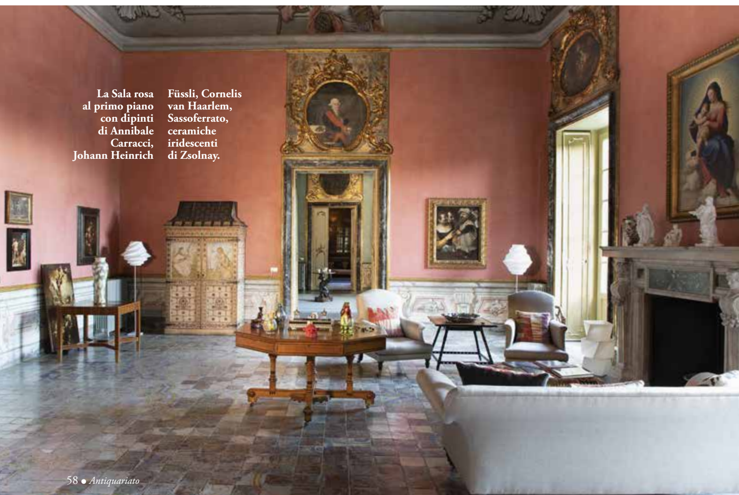
La Sala rosa al primo piano con dipinti di Annibale Carracci, Johann Heinrich Füssli, Cornelis van Haarlem, Sassoferrato, ceramiche iridescenti di Zsolnay.